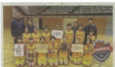
SAKAI.G.G (坂井市) 日頃の練習が実を結び、創部3年で念願の全国大会出場が決まりました。コロナ禍でも負けじとメンバー丸となって、頑張っています。